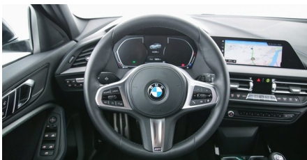
bmw-reichhart.at | 07238 2588 | info@reichhart.bmw.at