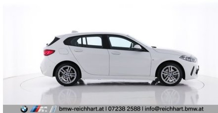
bmw-reichhart.at | 07238 2588 | info@reichhart.bmw.at