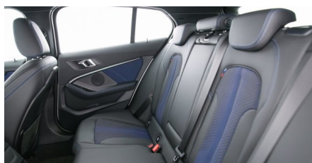
bmw-reichhart.at | 07238 2588 | info@reichhart.bmw.at